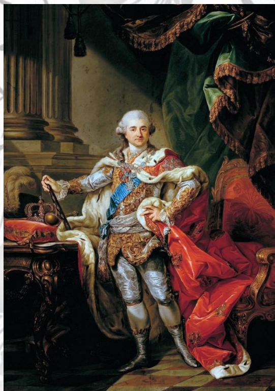
Król Stanisław August Poniatowski